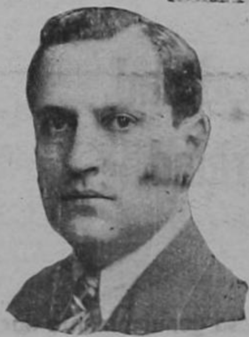
DR. DON RAFAEL ANGEL CALDERON GUARDIA